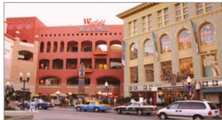
ダウンタウンの中心にある巨大モール。

ダウンタウンにある便利なショッピングモール。カジュアルラインの洋服や雑貨、生活用品、書籍など何でも手に入るショッピングモール。街中にあるため、規模も大きすぎず無理なく回れます。