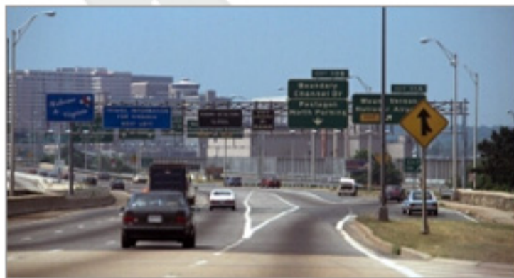
カメラをお忘れなく!

ファミリーでも十分楽しめるルートです。サンディエゴの見どころも訪れて、ショッピングも巡ります。陽気なドライブを存分に楽しもう!