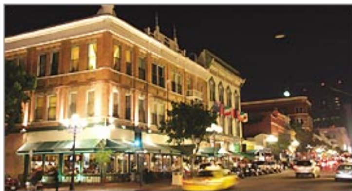
ライトアップされた美しい街並み。

ナイトライフを満喫するなら迷わずこの街へ! レンガ造りの店や石油のランプなど、ノスタルジックな雰囲気漂うガスランプクォーター。レストランやシアター、ナイトクラブが並び、道行く人々も華やかです。