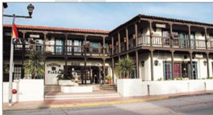
映画で見るような素朴な木造建築。

メキシコ文化が混じる入植当時のアメリカの姿。素朴な家屋や教会、メキシコの影響を受けた色づかいの看板など、絵本の世界に入り込んだような街です。お土産を買うのにぴったり。