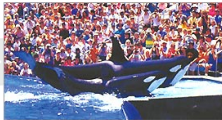
ダイナミックなシャチのショーは必見!

1日では回りきれないほどの広さとアトラクションやショーの数々。テーマパークの枠を越えたシーワールドはぜひ一度体験する価値あり!