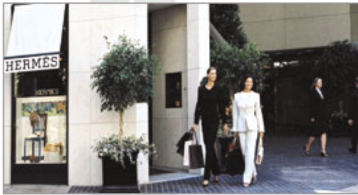
有名ブランドショップが多くあります。

ケタ外れの大きさを誇るサウスコースト・プラザ。テナントには高級ブランド店が多く治安も比較的良いので、落ち着いて買い物を楽しめます。