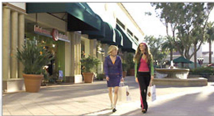
オープンエアで開放的なショッピングモール。

青空に向かってそびえるパームツリーが印象的なショッピング・モール。ハイセンス&セレブな雰囲気で、ひと味違う買い物を楽しめそう。