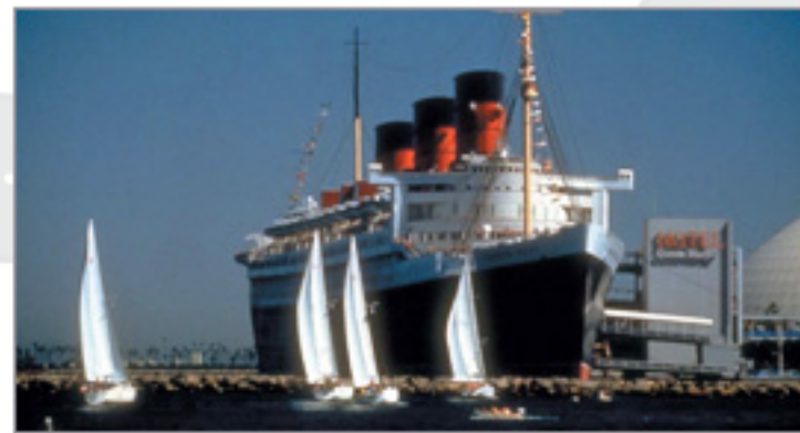
LAの南の半島にある臨海都市。今は重要な貿易港として栄えています。

アナハイムから西へ行くとロングビーチがあります。古くは貿易港として栄えたこの街は、豪華客船「クイーン・メリー号」がシンボルとして停泊。そのため当時の栄華を思わせるアール・デコ調の美しい景観と、近年開発された地域の雰囲気との対比が美しい港湾都市です。