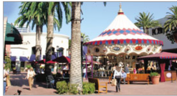
賑やかな雰囲気のショッピングセンター。

温暖な気候に恵まれた美しい港街。ヨットや船が海に浮かぶ優雅な雰囲気をもちつつ、海沿いにはおしゃれな店が並び、大型ショッピングセンターもあります。