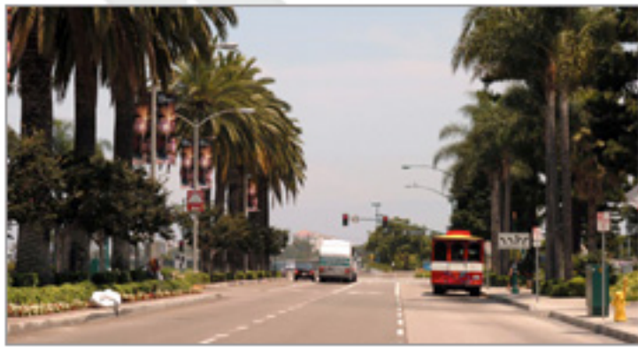
近場なのでドライブ初心者でも安心!

アナハイムを基点に近郊のスポットへGO! 近場のドライブルートなので、ドライブ初心者でも気負いせず楽しめます。荷物の量も気にせず、思いっきりショッピングしても大丈夫!