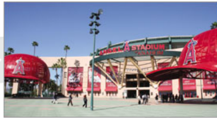
スタジアム外観。試合後は花火があがることも。

日本でもファンが多い「ロサンゼルス・エンジェルス・オブ・アナハイム」の本拠地。過去、長谷川滋利投手が大リーグ入りしたのもここ。